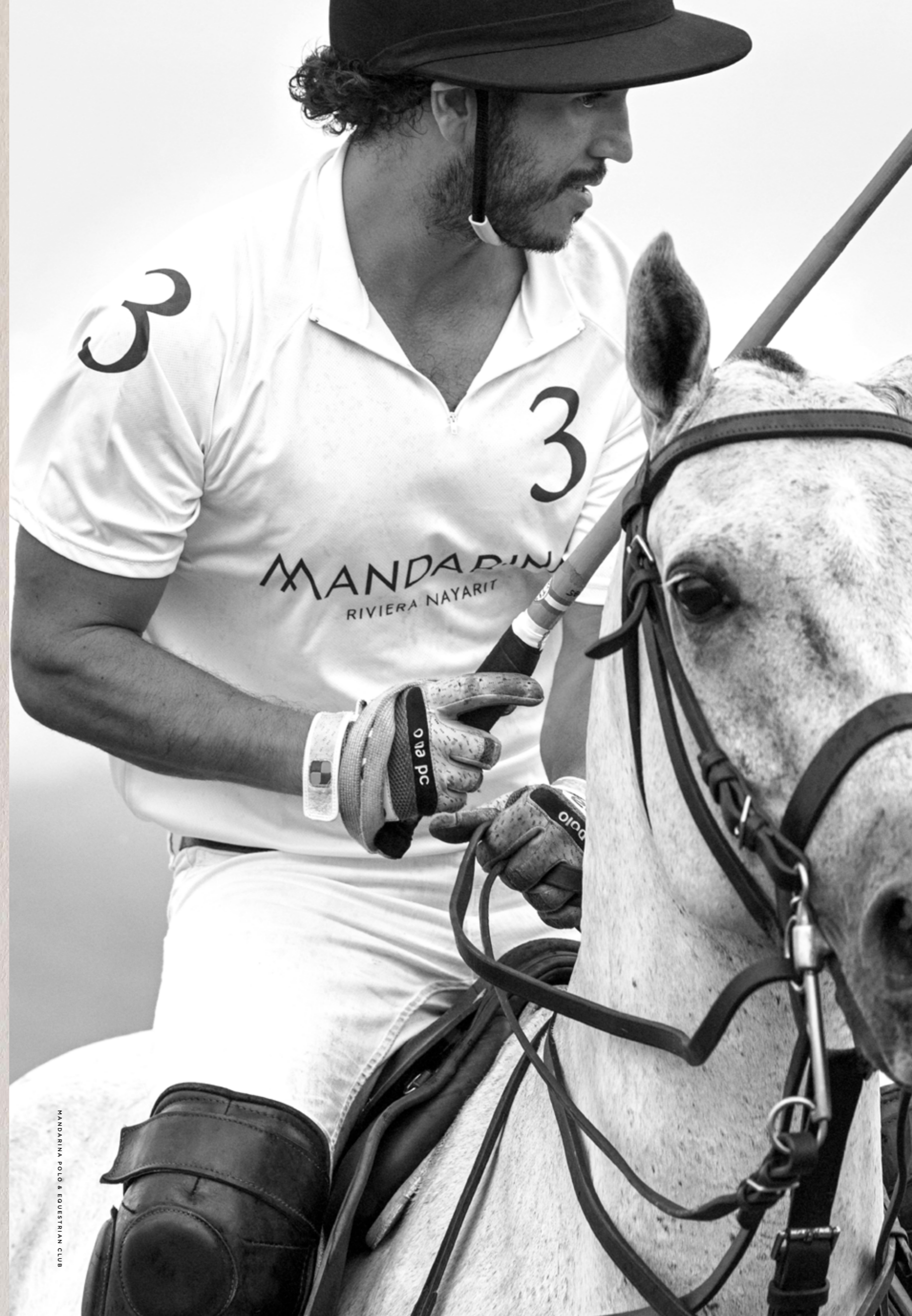
MANDARINA POLO & EQUESTRIAN CLUB