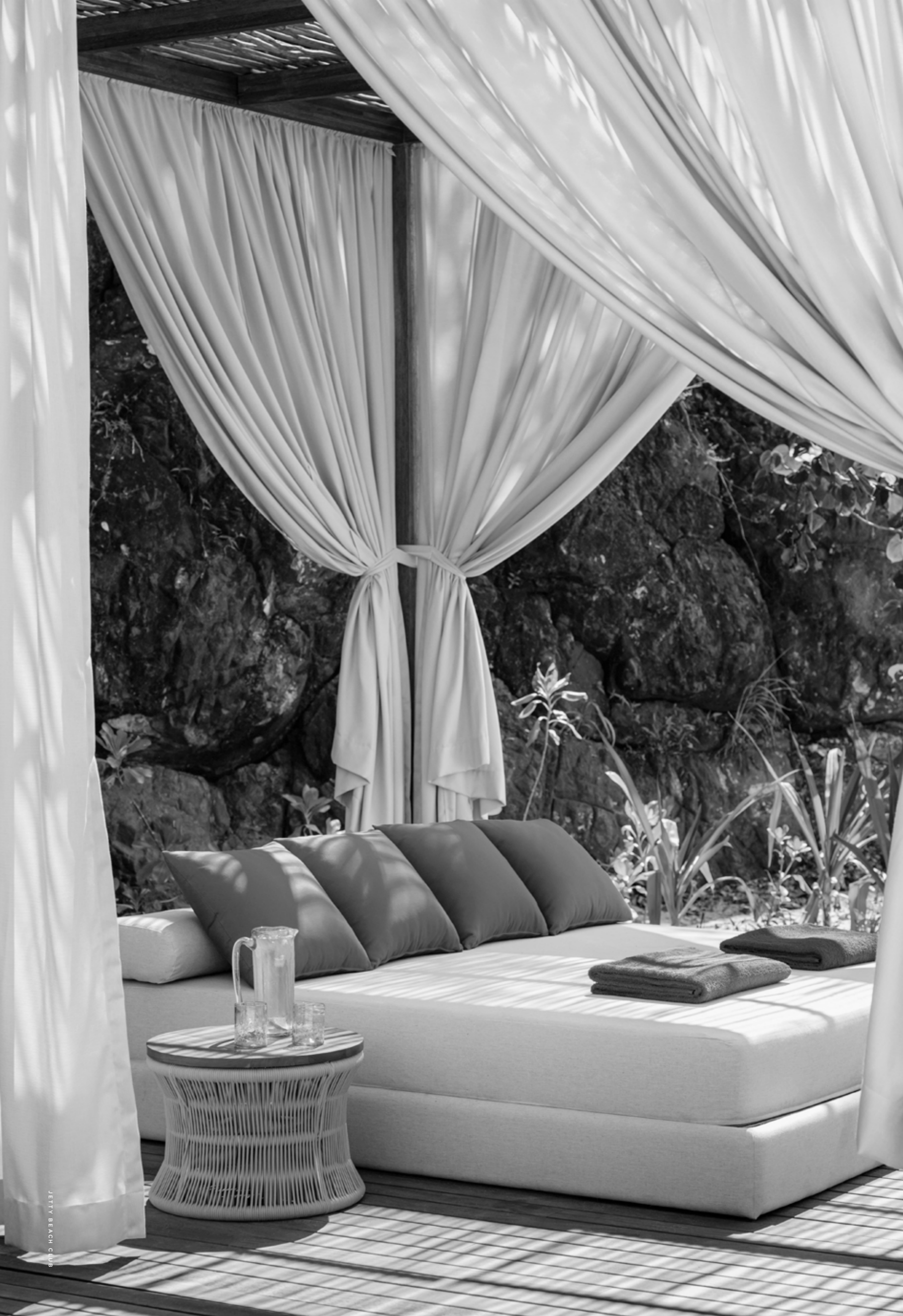
JETTY BEACH CLUB