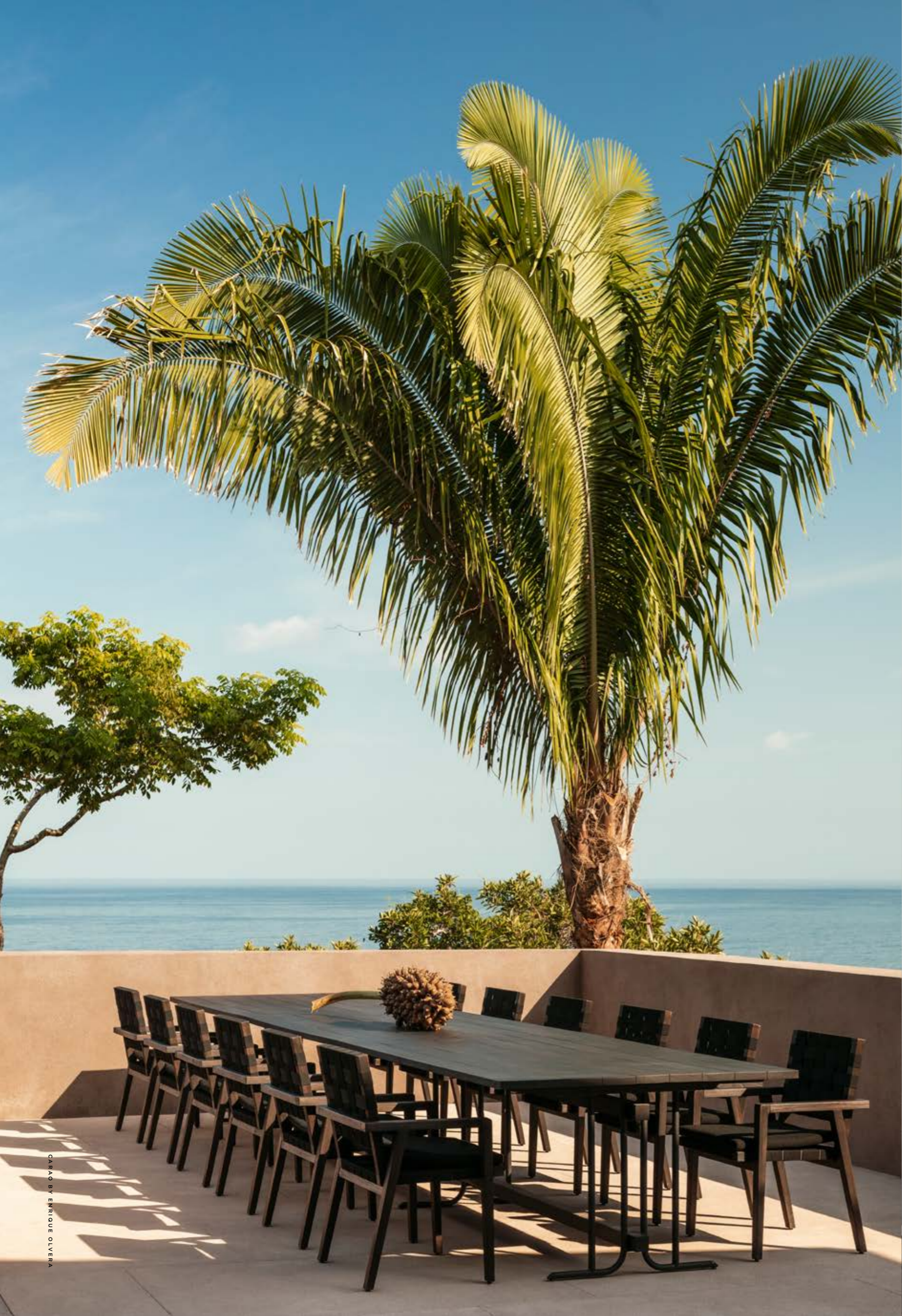
CASA BY ENRIQUE OLIVERA